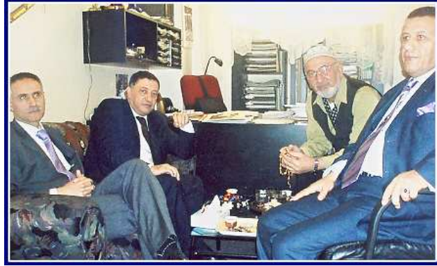
سفير المغرب السابق، الادرسي قيطوني، وكادر سفارته، في مكتب رئيس تحرير "بابلون" - براغ/ 2010

”بابلون“ في عامها الخامس والعشرين... ... ومن أرشيف صورها (15):